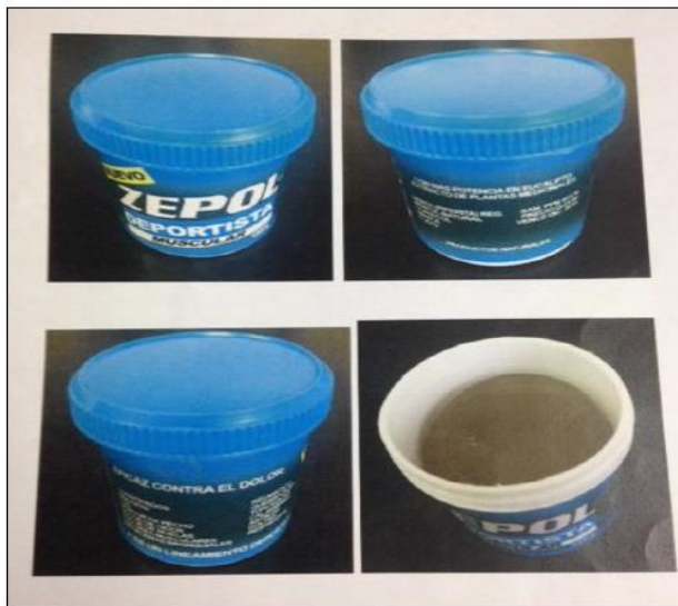
Imagen N° 2. Producto falsificado ZEPOL DEPORTISTA MUSCULAR en gel

MINISTERIO DE SALUD DIRECCIÓN DE REGULACIÓN DE PRODUCTOS DE INTERÉS SANITARIO San José, Distrito Hospital, Calle 16, Avenidas 6 y 8, Edificio Norte 4º piso Teléfonos: 2258-6765 / 2257-2090 Fax: 2257-7827 / 2257-20-90