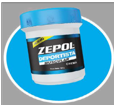
Imagen N° 1. Producto legítimo ZEPOL DEPORTISTA MUSCULAR en crema

El laboratorio fabricante ha comunicado esta situación al Ministerio de Salud de Guatemala y a las autoridades sanitarias de la región para que estemos alertas recordando que el Artículo 107 de la Ley N° 5395 General de Salud establece “Queda prohibido la importación, elaboración, comercio, distribución o suministro a cualquier título, manipulación, uso, consumo y tenencia para comerciar, de medicamentos deteriorados, adulterados o falsificados” .