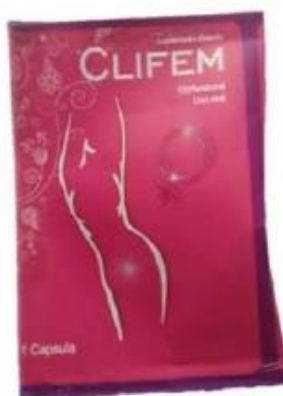
Datos del producto